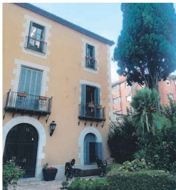
Can Senillosa

Oriünd de la Mediterrània oriental, s'ha introduït al nostre país de molt antic, però no ha arribat a naturalitzar-s'hi. Pot viure més de cinc-cents anys i se'n coneixen alguns exemplars mil·lenaris. La seva gran longevitat i el caràcter perennifoli de les seves fulles l'han situat com a símbol de la immortalitat i de la vida eterna.