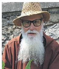
FRA VALENTÍ SERRA DE MANRESA

La pebrera o pebrotera (llat. Capsicum annum ; cast., pimiento ) i també la bitxera (llat., Capsicum frutescens ; cast., guindilla , chile ) procedeixen del centre i sud d'Amèrica.