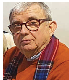
JOAN BUSCÀ I AMBRÓS

En el discurs de la presidenta de la Comissió de la Unió Europea en l'inici del nou curs anual sobre l'Estat de la Unió 2023/2024, va anunciar la proposta d'un nou Reglament que s'enviarà al Parlament Europeu en què preveu sancionar a les