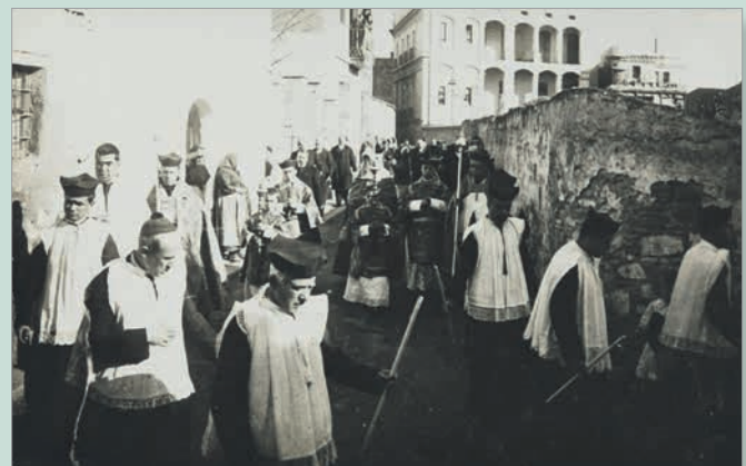
El carrer de Sant Miquel el 1906, amb el pas de la processó de Sant Vicenç. A la dreta de la foto, en primer pla, es pot veure el mur que delimitava l'hort del rector i, al fons, la façana posterior de la Casa Mumbrú.