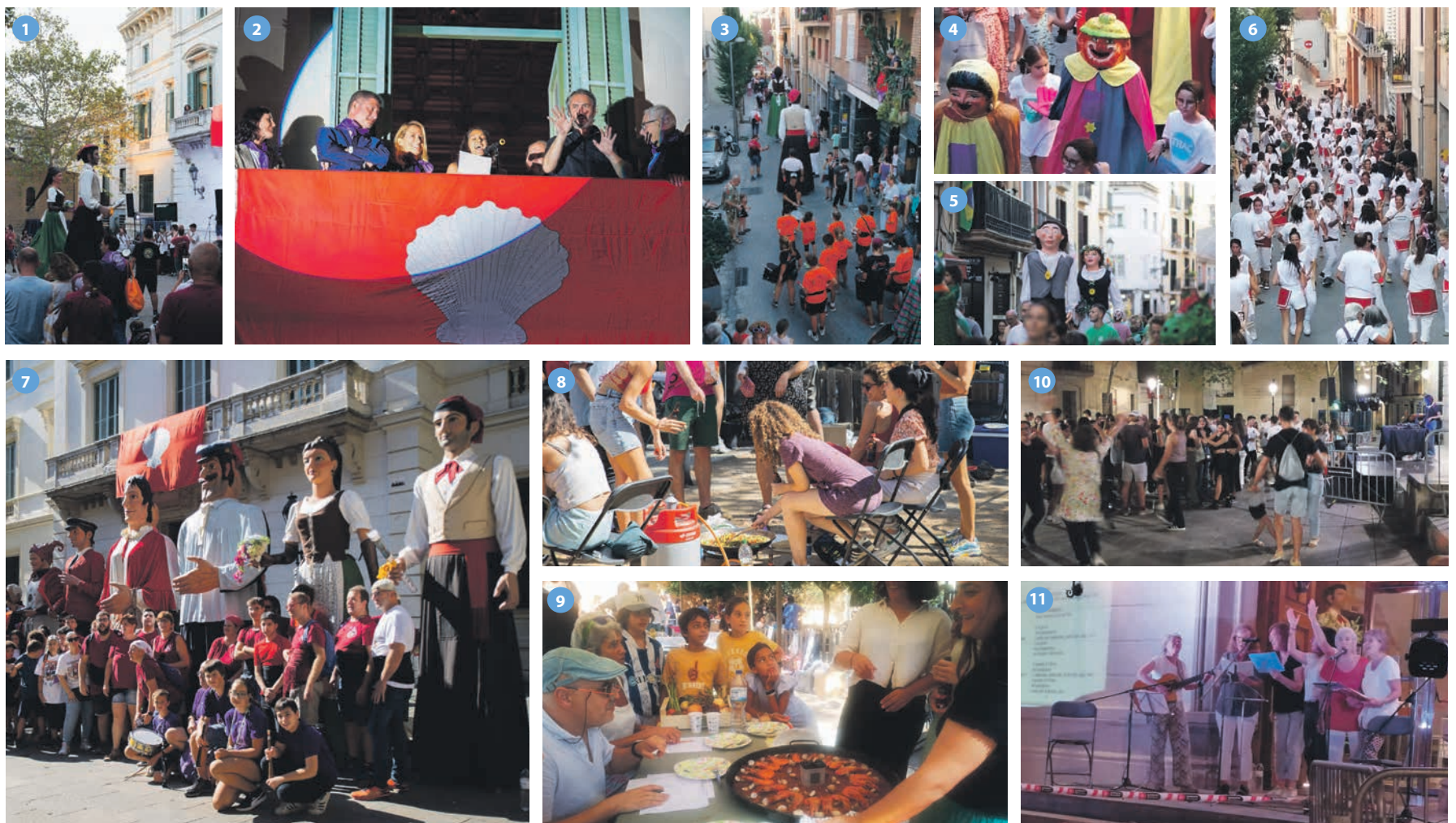
1. Toc d'inici amb els gegants i els castellers.

Passejant pel carrer Major amb sorpresa i satisfacció es veu a gent diferent. També hi són els amics i amigues de sempre i que aquests dies ens busquem, però hi ha molta altra gent, veïns o passavolants, joves i adolescents, que no els coneixes ni els tens vistos, però que gaudeixen igualment de la festa. Segueix, doncs, la Festa Major... que serà com cada any i, com sempre, es reinventa en cada activitat! Sigueu tots molt benvinguts i amb ganes de gaudir. Només us demanem respecte. ■